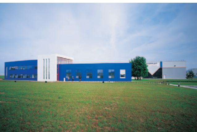
Zakład produkcyjny: Abbeville, Francja