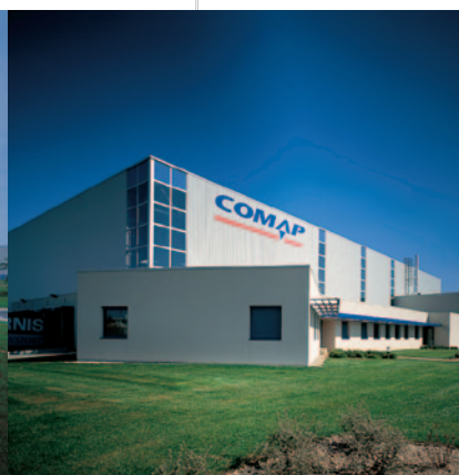
Centralny magazyn: Chécy, Francja