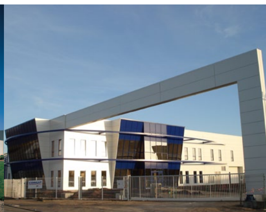
Zakład produkcyjny: Saint Denis de l' Hotel, Francja